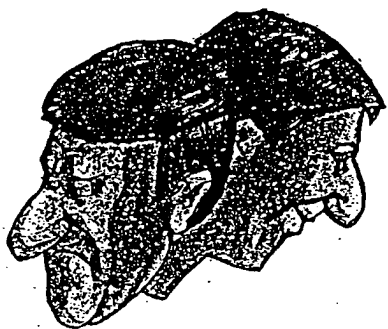
Changement de caractère