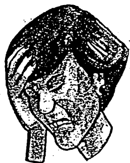
Maux de tête