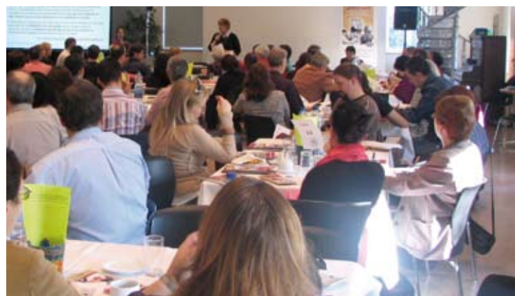
Participants-es lors du Forum sur le développement de la main-d'œuvre, 17 octobre 2008.