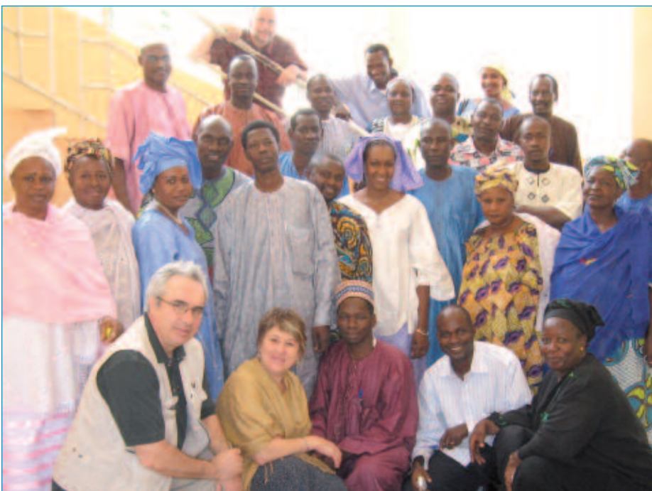
Les participants-es à la formation du CSMO-ÉSAC et du Chantier de l'économie sociale au Mali.

Le Comité sectoriel pourra soutenir, à la mesure de ses moyens, les entreprises ou réseaux ayant entrepris des études, notamment par le biais de la communication électronique.