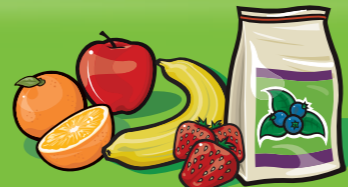
Fruits frais, surgelés ou en conserve 1 fruit ou 125 mL (½ tasse)