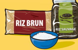
Riz, boulgour ou quinoa, cuit 125 mL (½ tasse)