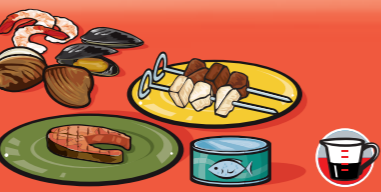
Poissons, fruits de mer, volailles et viandes maigres, cuits 75 g (2 ½ oz)/125 mL (½ tasse)