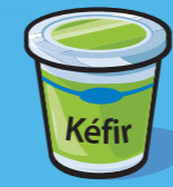
Kéfir 175 g (¾ tasse)