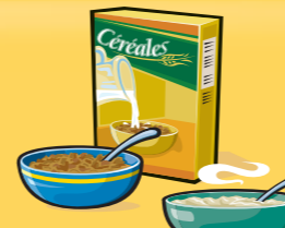
Céréales Froides : 30 g Chaudes : 175 mL (¾ tasse)