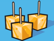
Fromage 50 g (1 ½ oz)