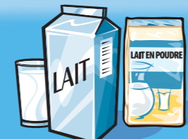
Lait ou lait en poudre (reconstitué) 250 mL (1 tasse)