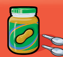
Beurre d'arachide ou de noix 30 mL (2 c. à table)