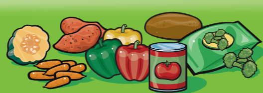
Légumes frais, surgelés ou en conserve 125 mL (½ tasse)