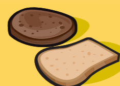
Pain 1 tranche (35 g)