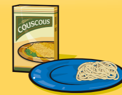
Pâtes alimentaires ou couscous, cuits 125 mL (½ tasse)