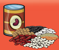
Légumineuses cuites 175 mL (¾ tasse)