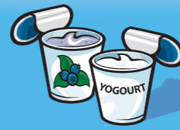
Yogourt 175 g (¾ tasse)