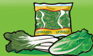
Légumes feuillus Cuits : 125 mL (½ tasse) Crus : 250 mL (1 tasse)