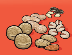
Noix et graines écalées 60 mL (¼ tasse)

Le tableau ci-dessus indique le nombre de portions du Guide alimentaire dont vous avez besoin chaque jour dans chacun des quatre groupes alimentaires.